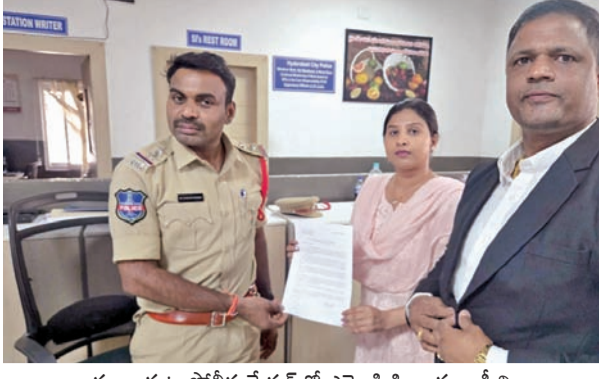
పంజాగుట్ట పోలీసు స్టేషన్ లో ఎస్పీకి ఫిర్యాదు కాపీని అందజేస్తున్న సింగర్ మంగ్లి